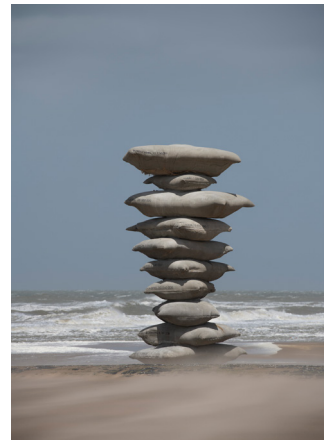
ROSA BARBA Pillage of the Sea