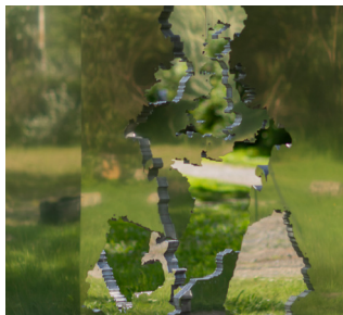
NICOLÁS LAMAS Unstable Territories