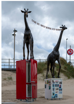
RAPHAËLA VOGEL There Are Indeed Medium-Sized Narratives

Sla vervolgens linksaf naar de Christinastraat, sla rechtsaf naar de Sint-Sebastiaansstraat, ga verder in de Nieuwstraat om opnieuw op de knooppunten-route te komen.